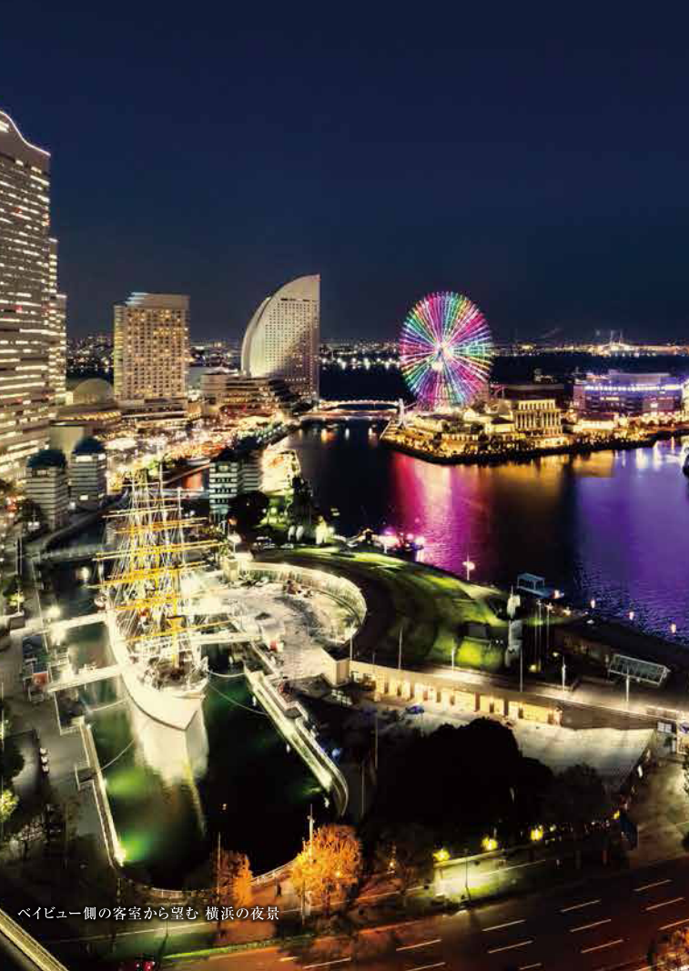
ベイビュー側の客室から望む 横浜の夜景