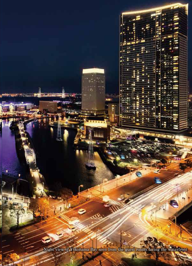
Night view of Yokohama Bay seen from the guest rooms facing the waterfront